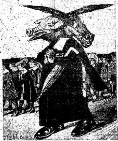
O professor bicephalo As suas duas cabeças a paralisar

Na escola clerical, o professor é o centro de tudo. O aluno deve aprender a obedecer e a respeitar o professor. A escola clerical não se preocupa com a formação do indivíduo, mas com a transmissão de conhecimentos. A escola clerical não se preocupa com a formação do indivíduo, mas com a transmissão de conhecimentos. A escola clerical não se preocupa com a formação do indivíduo, mas com a transmissão de conhecimentos.