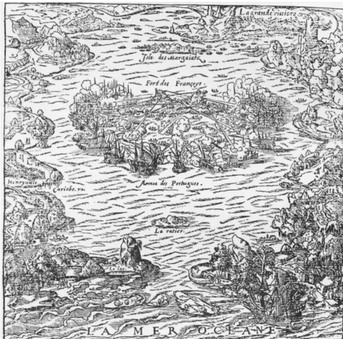
Mapa da batalha de Mem de Sá contra os franceses na Baía de Guanabara, em 1560, de autoria desconhecida, datado de 1567.