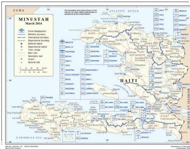
MINUSTAH map as at March 2014