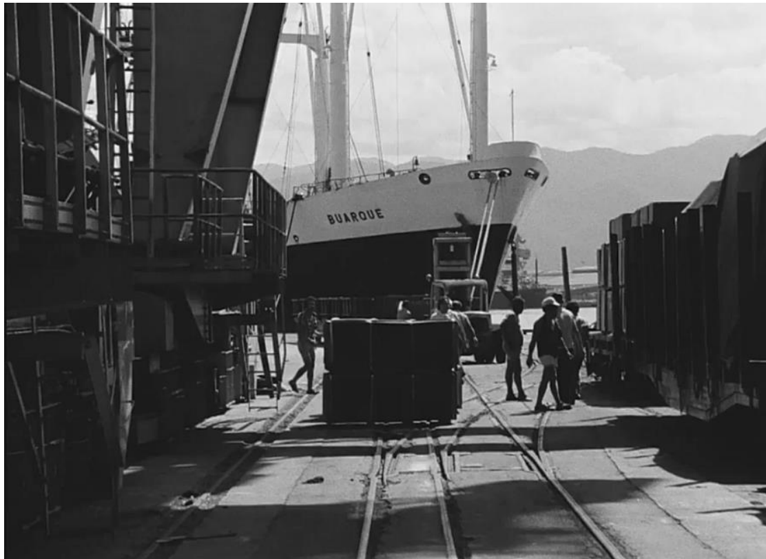
Figura 05: O porto-protagonista em O Porto de Santos (Aloysio Raulino, 1978).