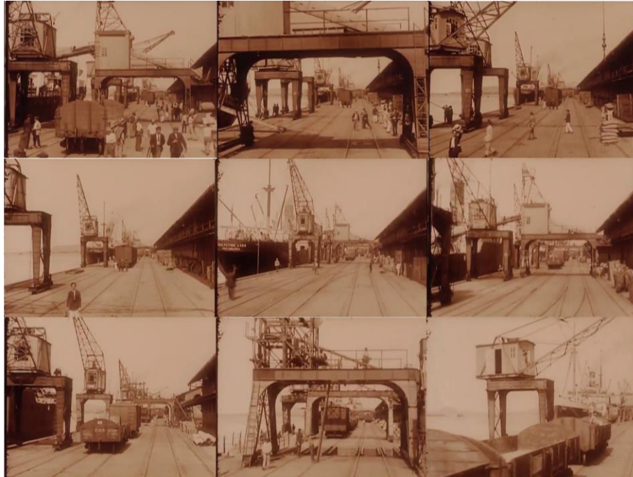
Figura 01: A câmera que passa por pessoas, trilhos, vagões e galpões em O Porto de Santos (Diretor desconhecido, 1926-1929).

inicialmente distante que se aproxima da lente à medida que a câmera continua seu passeio rumo ao horizonte que parece não ter fim. A câmera é percebida pelos transeuntes, que param, acenam e retiram o seu chapéu em cumprimento ao aparelho óptico.