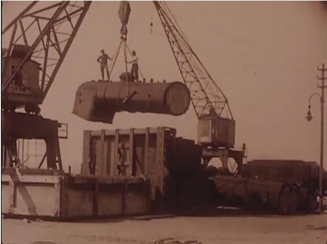
Figura 02: Os trabalhadores suspensos em O Porto de Santos (Diretor desconhecido, 1926-1929).