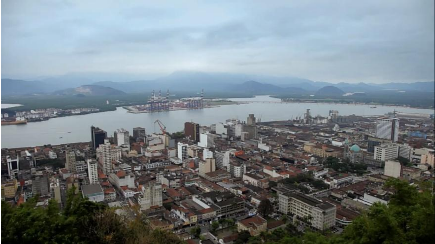
Figura 09: Frame de Nau Insensata (Cristiano Sidoti, 2018).