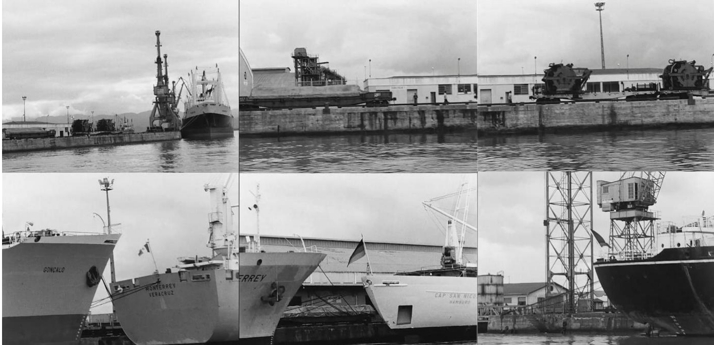
Figura 11: A câmera-barco em O Porto de Santos (Aloysio Raulino, 1978): Mostrar o Porto, mas também suas particularidades.