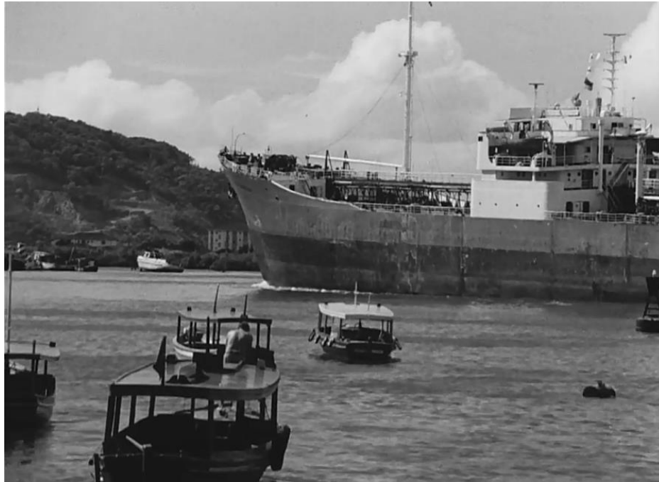
Figura 04: Frame do Momento-foley-buzina em O Porto de Santos (Aloysio Raulino, 1978).

individualizadas que através da montagem permitem a associação imagem/áudio ao serem exibidos de forma conjunta. Sem narração ou suporte na explicação da narrativa, o diretor deixa imagens e áudios entrarem e saírem do quadro seguidamente, assumindo controle provisório da narrativa e dando ao espectador a possibilidade de construir suas próprias associações a partir desses elementos. Até então, por volta de 3 minutos e 30 segundos, o Porto de Santos é o protagonista, tendo a si mesmo enquanto porto retratado a partir de sua própria representação audiovisual.