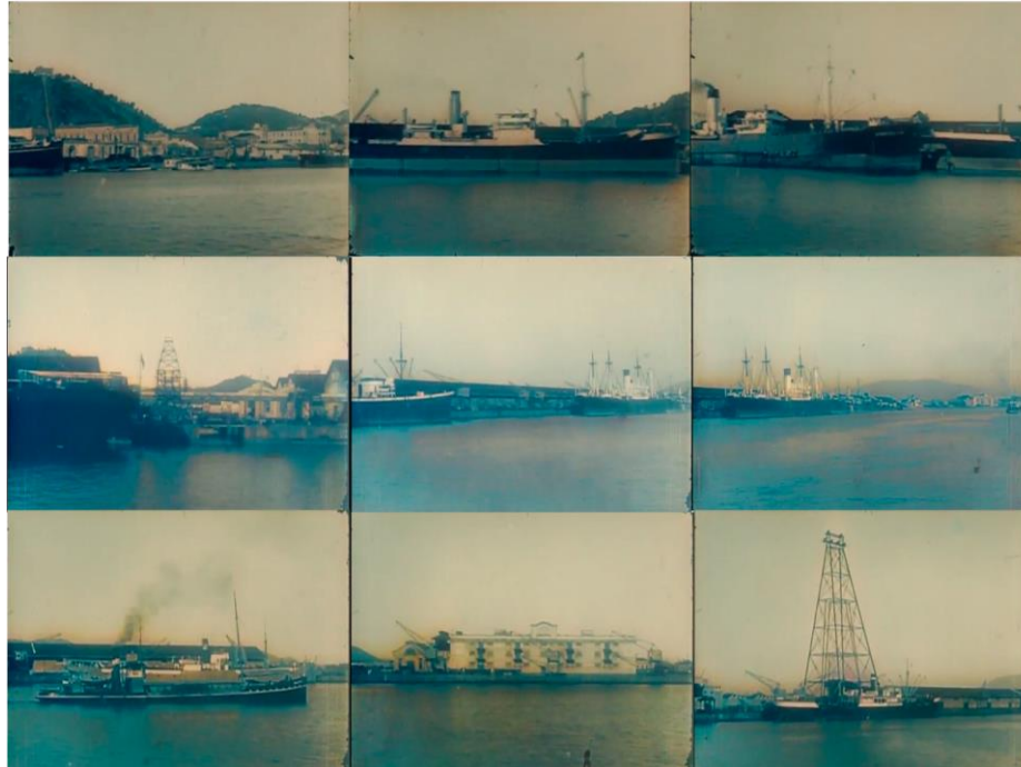
Figura 10: A câmera-barco em O Porto de Santos (Diretor desconhecido, 1926-1929): mostrar a imensidão do Porto, no tempo que for preciso.

exemplo que sintetiza tal atuação, mas o aparelho que registra o Porto se aprofunda na intimidade do ambiente por meio de registros das mais variadas formas: travellings , panorâmicas, tilts , tomadas estáticas. O Porto de Santos se torna um espaço para a experimentação de linguagem nestas três obras ao passo que se tenta retratá-lo.