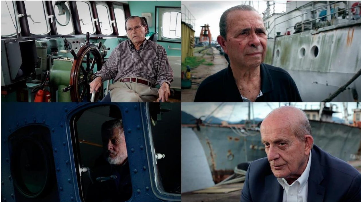
Figura 07: Os personagens de Nau Insensata (Cristiano Sidoti, 2018).

interior da sala de controle; outro personagem está no cais, com o mar e um navio ao fundo. Os personagens contam as suas experiências particulares enquanto estiveram presos no Raul Soares, os métodos de tortura que sofreram e as formas de convivência do navio-prisão, depoimentos potencializados com o auxílio da imagem como reconstrutora do vivido, dando ao espectador o poder de criar o ambiente vivido no navio-prisão.