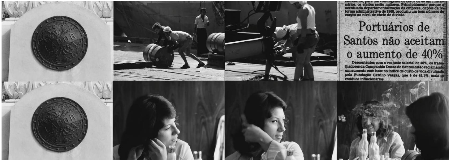
Figura 06: As duas sequências-Labor de O Porto de Santos (Aloysio Raulino, 1978).

pedem o registro das suas imagens e pedem para contar suas histórias, de sair da invisibilidade pelo audiovisual. Os elementos das trilhas sobrepostas à esta sequência evidenciam o amadurecimento precoce a que essas mulheres colocam sobre si mesmas em troca da subsistência.