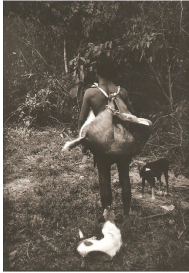
Figura 20 – Caçador feliz ou marupiará

A reciprocidade envolvendo carne é vital para que não haja excedente ou miséria entre as casas. De fato, parece que as casas estão sempre em “dívida”; umas com as outras.