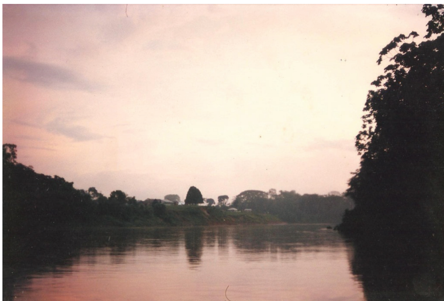
Figura 3 – Foz do Breu (II)

Ao marido, à filha. À mãe e ao pai. Aos avós de nós.