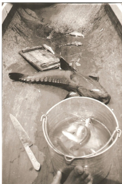
Figura 19 – Bodó, cuiú e mandim

Os moradores indicam algumas referências espaciais que servem como limites da colocação Depósito. O Igarapé Piaba, ao Sul, o Igarapé Quatorze ao Norte. No entanto, tais limites físicos não restringem a ocupação humana e familiar. Nem o efetivo uso dos recursos dispostos em zonas. Nas colocações, ou mesmo, entre elas.