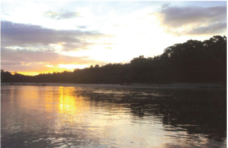
Figura 1 – Rio Juruá