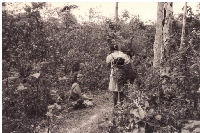
Figura 5 – Variação Rio Juruá