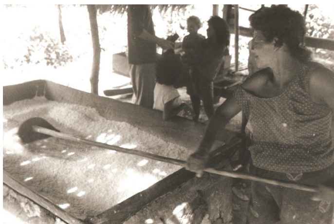
Figura 18 - Torrar massa

Muitos moradores, abaixo e acima no igarapé, visitam a Colocação Depósito para utilizarem sua casa-de-farinha comunitária. Ela tem o aviamento completo. Motor, a bola ou caititu para cevar ou ralar a macaxeira até formar uma massa . A prensa para retirar a manicuera ou o líquido oriundo da massa espremida. As peneiras e cochos. O forno e sua caixa para torrar a massa .