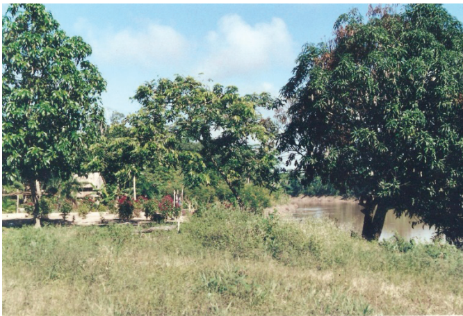
Figura 13 – Terreiro de colocação

Como dito, uma colocação contém um número variável de casas. As casas estão envoltas pelos terreiros, áreas de mata e suas zonas de uso. Cada casa, e seu (sua) respectivo (a) chefe de família, detém o uso sobre uma ou mais estradas de seringa disponíveis na colocação.