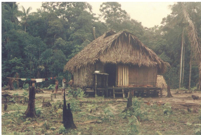
Figura 11 - Colocação