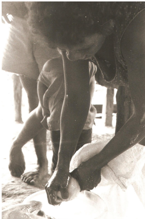
Figura 27 – Tirando goma da macaxeira

As mulheres também são responsáveis pela divisão e preparação das carnes de caça ou peixe, obtidas pelos homens. Depois de um longo dia, as mulheres podem receber animais para serem tratados, salgados e preparados ainda para o jantar daquele dia.