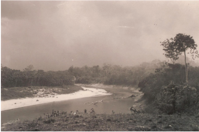
Figura 28 – Volta Grande, Rio Juruá

Pelo menos um dos filhos deve permanecer ao lado dos pais na velhice. Fornecendo apoio e trabalhos diversos. Vizinhando carne e peixe. No discurso dos filhos ressalta-se o dever moral em servir os pais na velhice.