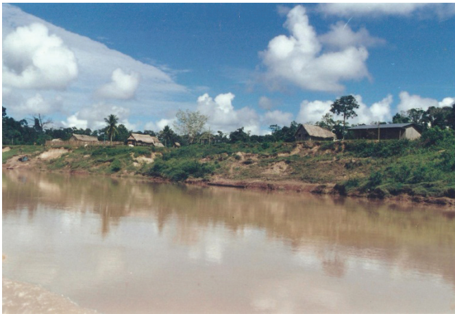
Figura 10 - Fazenda Natal, Rio Juruá