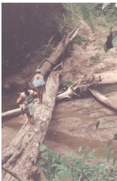
Figura 6 – Variação Igarapé Dourado