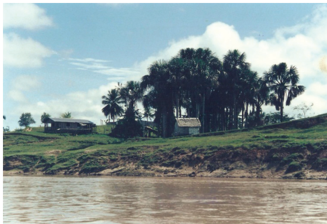
Figura 16 - Fazenda

Depois da vila de Marechal Thaumaturgo, atual município, foram necessárias 12 horas de canoa com motor até a foz do Igarapé São João. E o percurso ainda continua.