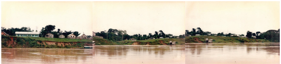
Figura 2 – Foz do Breu (I)