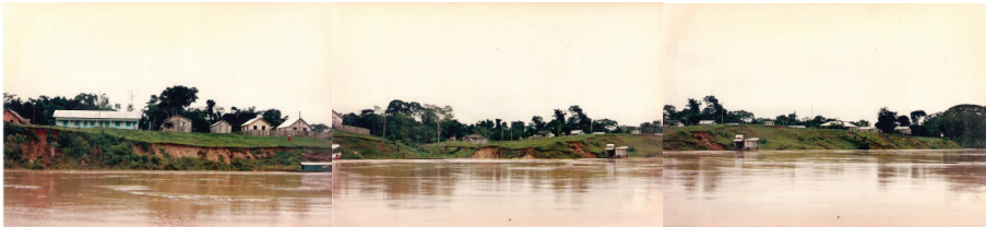
Figura 22 - Vila Foz do Breu

Passo a descrever, então, a Vila Foz do Breu. Objeto de nossa comparação com a colocação Depósito.