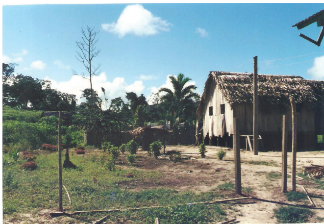
Figura 15 – Terreiro

Caso haja poucas estradas disponíveis, pode haver questão ou conflito. Mas, primeiramente haverá negociação referente ao uso das estradas. Ou negociações sobre estradas vadiando ; que não estão sendo cortadas. Ou ainda, a divisão de estradas com muitas madeiras. Em último caso, o morador que não tem estradas, pode ir para outra colocação vizinha que as tenha. Em quantidade suficiente.