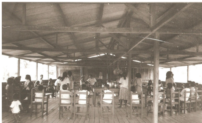
Figura 17 - Sede da Asareaj

O movimento de moradores subindo e descendo o igarapé São João é intenso. Seja para buscar um remédio, visitar conhecidos. Caçadas ou festas. Andar de canoa pelo igarapé, só no período do inverno. Quando há água suficiente para navegá-lo.