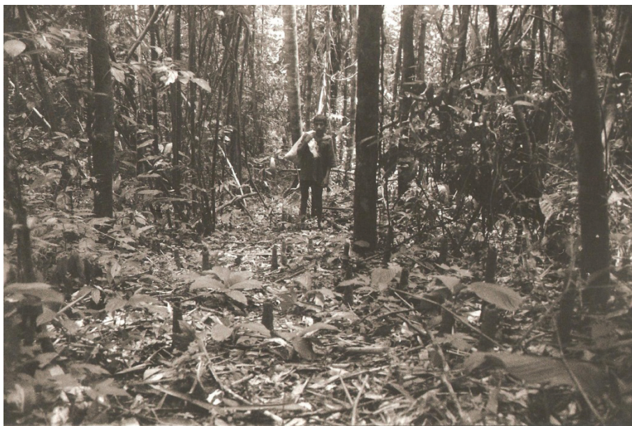
Figura 26 – Menino pequeno-grande

Pequeno-grande foi uma categoria utilizada pela velha Ernestina para designar esta categoria de menino. Disse-me ela, certa vez: - Eu era desses, pequeno-grande que lutava com menino... Cozinhava. Batia roupa. Cuidava da casa. Fazia de tudo [...].