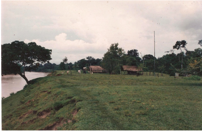
Figura 25 – Campo na Foz do Breu