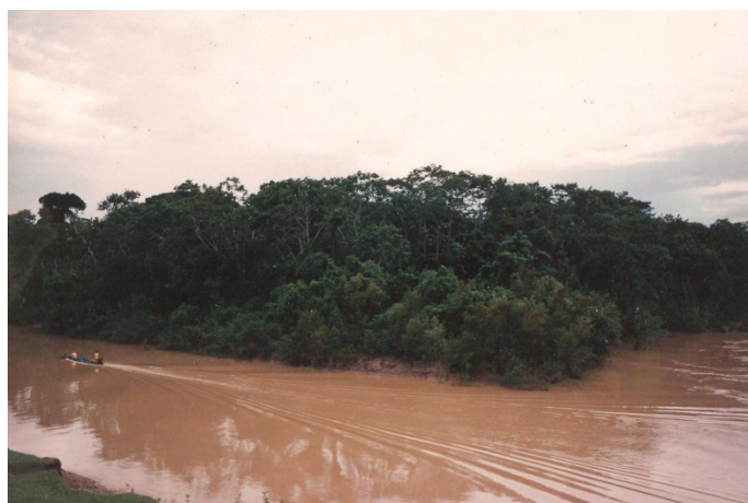
Figura 7 - Foz do Breu (III)

Quero dizer que o recorte utilizado, constrói o objeto de que trato. O recorte caracteriza os objetos de que tratamos. E eu, poderia fornecer uma Foz do Breu “clássica”; cujos limites são geograficamente formulados a partir de uma noção de estrutura - sistêmica social. De uma “pauta ideal” no dizer de Edmund Leach.