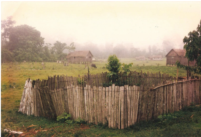
Figura 23 - Campo na Foz do Breu

Em outubro de 1994, quando visitei a Vila Foz do Breu pela primeira vez, ela tinha treze casas. Dois anos depois, em 1996, já são 20 casas e 100 moradores. Já as colocações vizinhas à Vila Foz do Breu, Vista Alegre, abaixo e Seringueira, acima, tinham três casas cada. Eram, pois, 19 casas na área da circunscrição da vila.