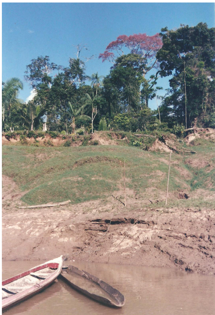
Figura 14 – Porto no Rio Jurua

Sua variância é considerada na disposição das casas. E no tamanho da área disponível para cada colocação, bem como, na divisão dos recursos entre os grupos domésticos. E ainda, na distribuição de recursos provenientes do seu usufruto, entre vizinhos.