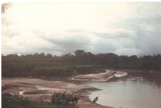
Figura 12 - Foz do Igarapé Caipora

Para Zé Rubens, morador na colocação Foz do Caipora: