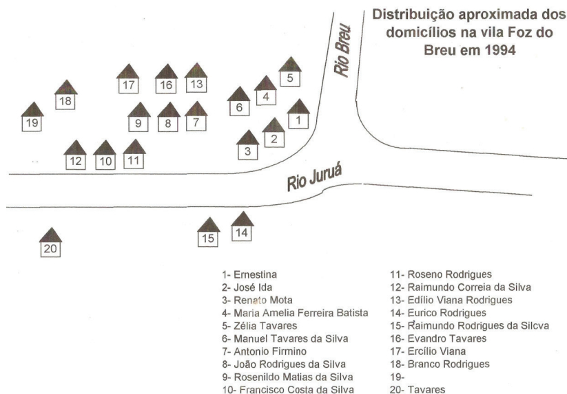
Figura 24 - Foz do Breu