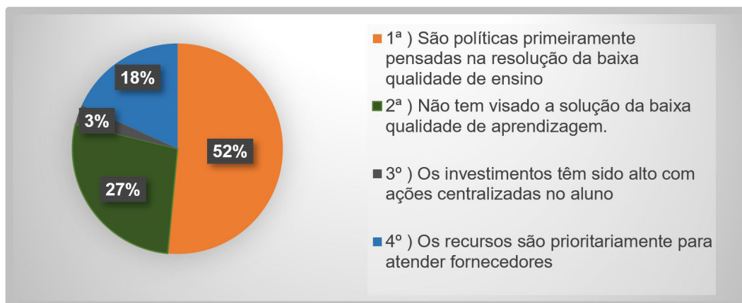
Gráfico 2 - No que tange às Políticas Públicas implementadas na rede estadual de ensino do Amazonas.

Ao explorar as respostas obtidas na pesquisa sobre as políticas públicas executadas na rede estadual de ensino do Amazonas, os dados revelam uma significativa divergência de opiniões entre os participantes. A questão que buscava identificar a perspectiva dos respondentes sobre o direcionamento dessas políticas forneceu uma visão complexa e multifacetada.