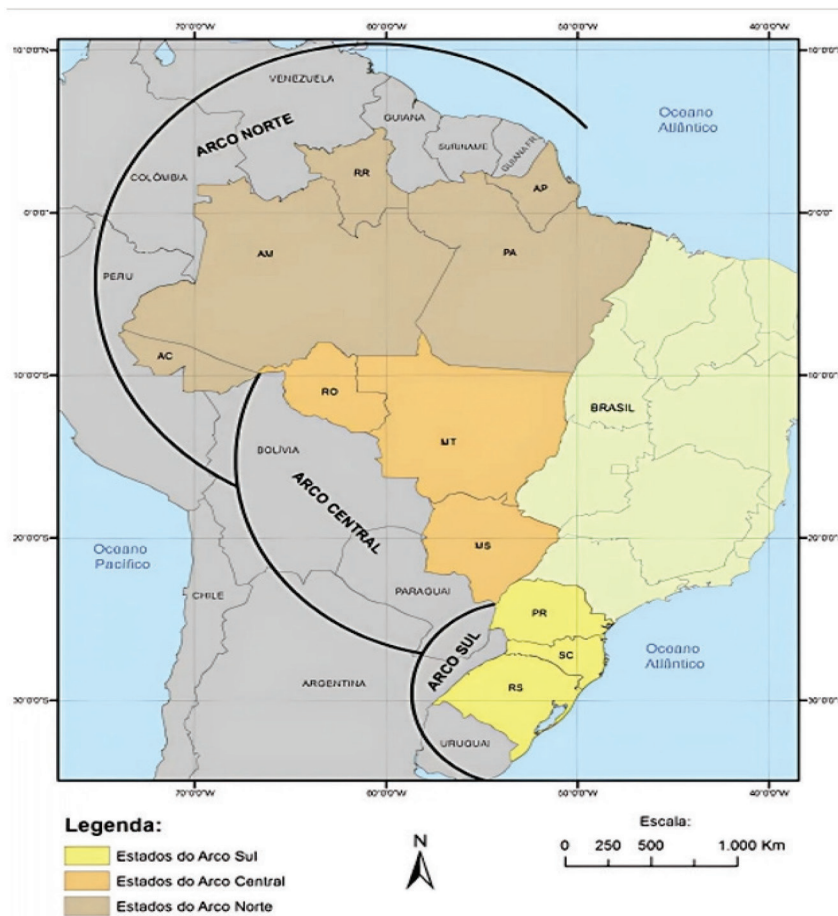
Figura 1. Arcos definidos a partir da proposta de reestruturação do Programa de Desenvolvimento da Faixa de Fronteira

Atualmente, a base territorial das ações do Governo Federal para a faixa de fronteira estabelece como áreas de planejamento três grandes arcos, definidos a partir da proposta de reestruturação do Programa de Desenvolvimento da Faixa de Fronteira (PDFF – 2005), com base na Política Nacional de Desenvolvimento Regional (PNDR) do Ministério da Integração. (Brasil, 2010). A figura 1 ilustra os três arcos acima descritos: