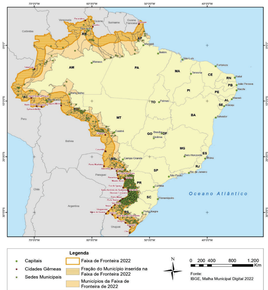
Figura 2. Concentração de municípios em Faixa de Fronteira.