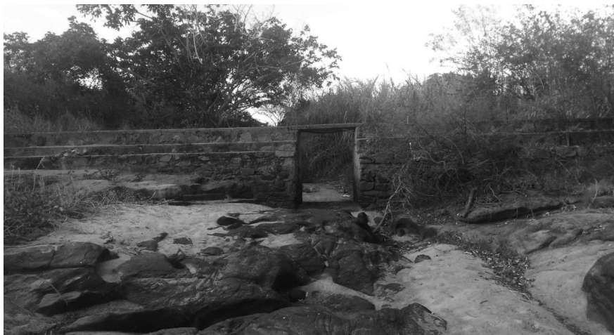
Imagem 04: Barragem na localidade de Vazante, Croatá – CE.