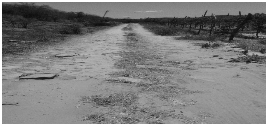
Imagem 01: Calçamento na localidade de Buriti dos Bragas, Croatá – CE.